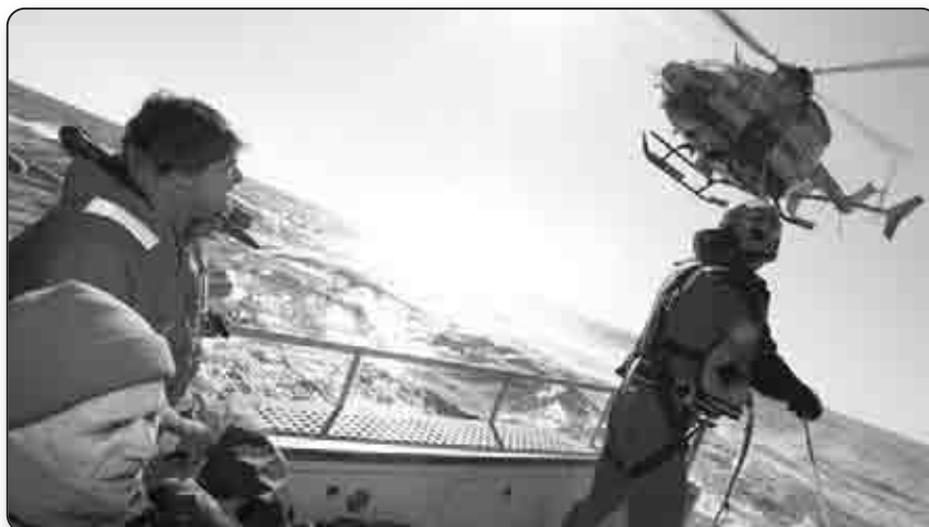
Au cœur de l'entraînement