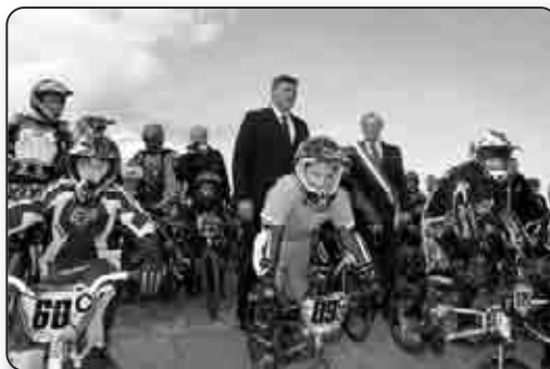
Des politiques au service des jeunes, la tête dans le guidon...

Fédération Française de Cyclisme porte ses fruits puisque la FFC a enregistré une hausse constante de ses licenciés BMX depuis 2009 (+22%) lui permettant, pour la première fois de son histoire, d'atteindre un nouveau record avec 113 000 licences délivrées au total dont près de 20 000 en BMX. Créée en 1993, la Fondation Française des Jeux soutient par ailleurs depuis 18 ans de nombreux projets associatifs visant à éduquer et à insérer par le biais du sport et encourage dans le même temps la pratique du sport par les handicapés. Premier partenaire du sport français, sponsor d'une équipe cycliste depuis 15 ans, la Française des Jeux porte une vision du sport durable, fondée sur 4 convictions solidaires : « promouvoir les valeurs du sport, faire jouer au sport son rôle social, se battre pour l'intégrité et développer l'économie du sport. » Elle s'est engagée dans une politique de développement durable en redistribuant notamment