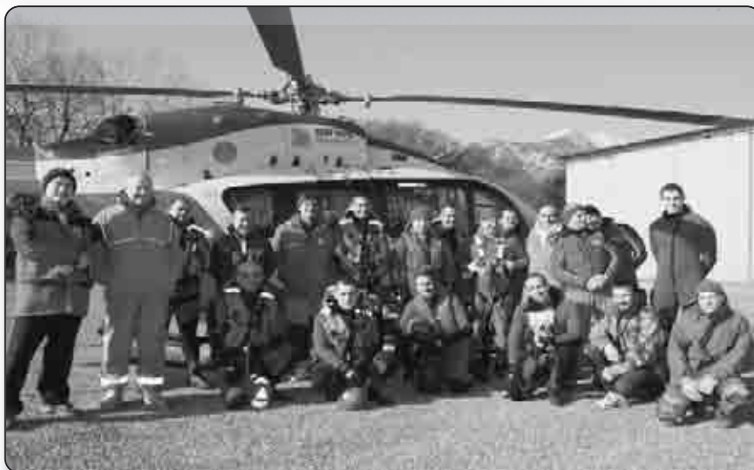
Les pompiers prêts pour la journée d'entraînement avec la SNCM