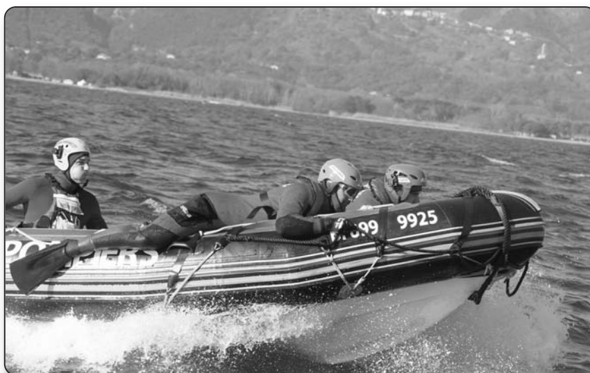
Exercice à bord du zodiac